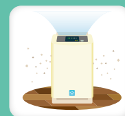
プラスマクラスター機能付き 空気清浄機の設置