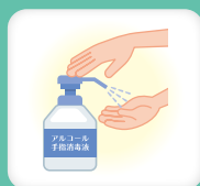
手洗いや アルコール等での手指消毒