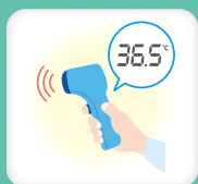
スタッフの 出社前検温