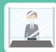
受付の ビニールシート設置