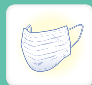
スタッフの マスクの着用